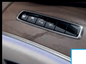
Rijassistentiepakket Plus (P20) € 2.904