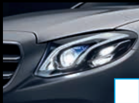
Multibeam LED (P35) € 1.313