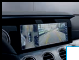
Parkeerpakket met 360°-camera (P44) € 774