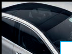
Panoramashuifdak (413) € 2.142