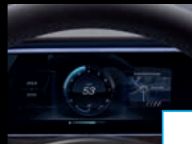
Widescreen cockpit (464) € 1.000