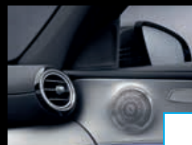
Burmester® Surround-Sound- systeem (810) € 1.029