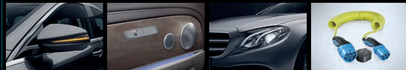
Spiegelpakket (P49): automatisch dimmende binnen en linker buitenspiegel en buitenspiegels elektrisch inklapbaar